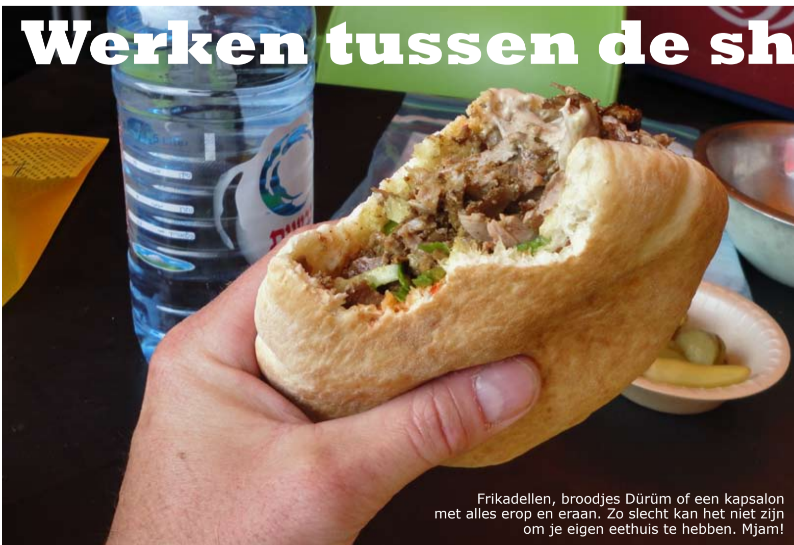
Frikadellen, broodjes Dürüm of een kapsalon met alles erop en eraan. Zo slecht kan het niet zijn om je eigen eethuis te hebben. Mjam!