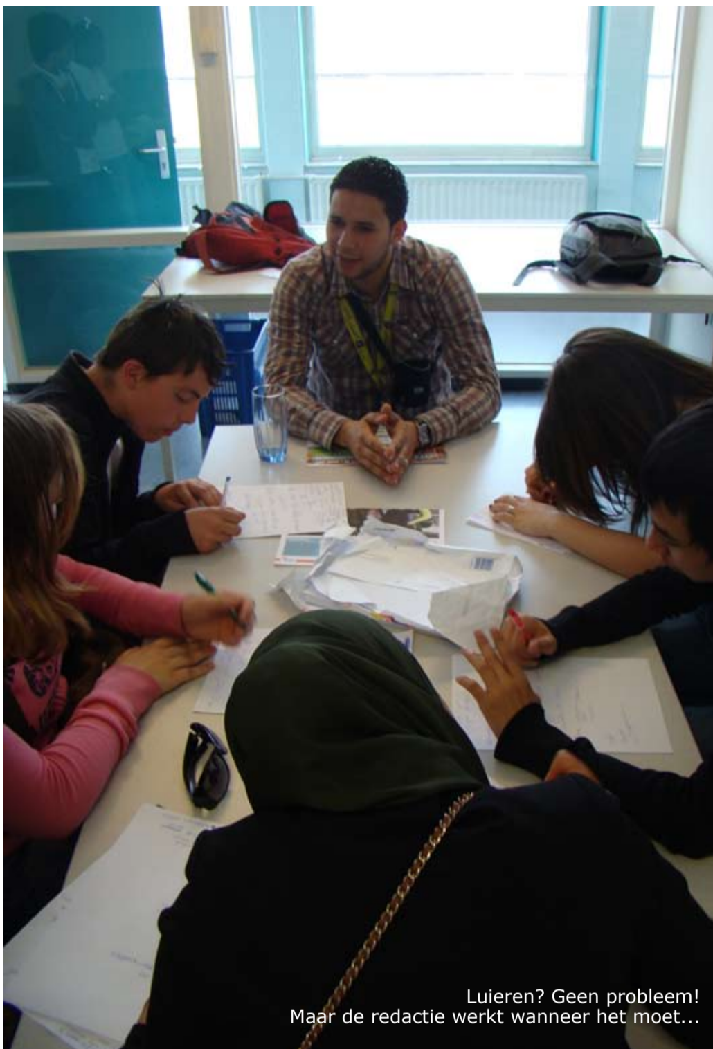
Luieren? Geen probleem! Maar de redactie werkt wanneer het moet...