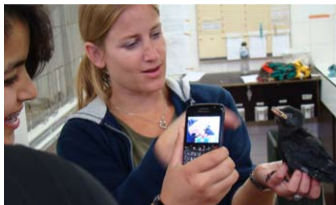
Jonge vogels. Kan het schattiger?