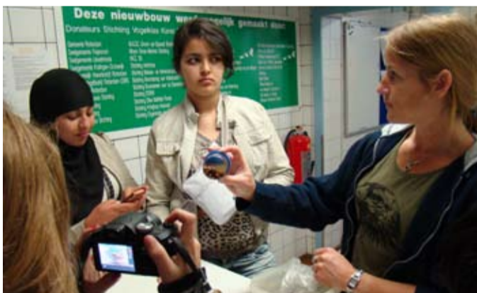
Een vies gezicht. Bloedzuigende teken in een potje. "Ze zijn toch wel écht dood hè?"

En als er daarna dan een roofvogel op de gewonde vogel af komt, kan ook die geplet worden door een paar autobanden. Oppassen dus! Want dieren willen net zo fijn leven als mensen."